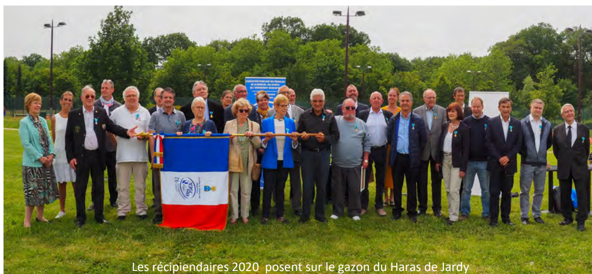
Les récipiendaires 2020 posent sur le gazon du Haras de Jardy